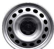
Felni közép "DEMI STYLE" 17"