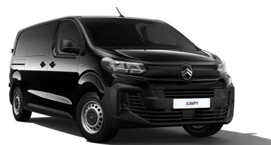
FEKETE PERLA NERA