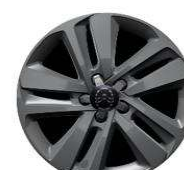
Alumínium keréktárcsa - STARLIT