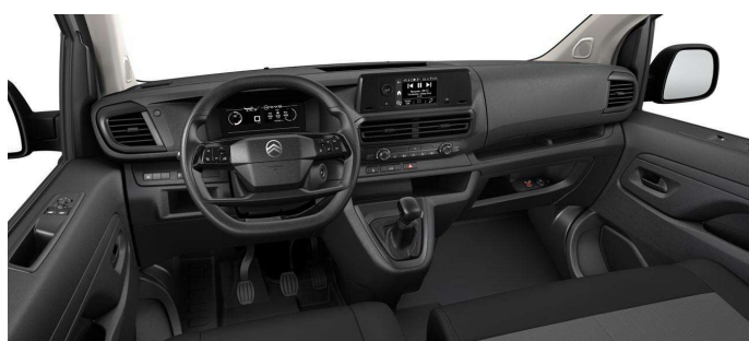
Vezetőhely (alap konfiguráció)