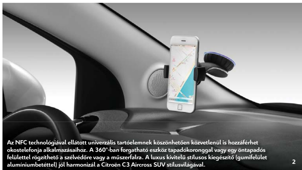
Az NFC technológiával ellátott univerzális tartóelemnek köszönhetően közvetlenül is hozzáférhet okostelefonja alkalmazásaihoz. A 360°-ban forgatható eszköz tapadókoronggal vagy egy öntapadós felülettel rögzíthető a szélvédőre vagy a műszerfalra. A luxus kivitelű stílusos kiegészítő (gumifelület alumíniumbetéttel) jól harmonizál a Citroën C3 Aircross SUV stílusvilágával.