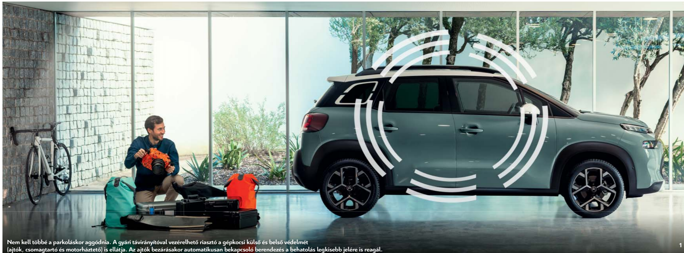
Nem kell többé a parkoláskor aggódnia. A gyári távirányítóval vezérelhető riasztó a gépkocsi külső és belső védelmét (ajtók, csomagtartó és motorháztető) is ellátja. Az ajtók bezárásakor automatikusan bekapcsoló berendezés a behatolás legkisebb jelére is reagál.