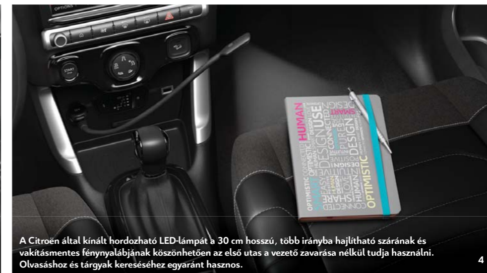
A Citroën által kínált hordozható LED-lámpát a 30 cm hosszú, több irányba hajlítható szárának és vakításmentes fénynyalábjának köszönhetően az első utas a vezető zavarása nélkül tudja használni. Olvasáshoz és tárgyak kereséséhez egyaránt hasznos.