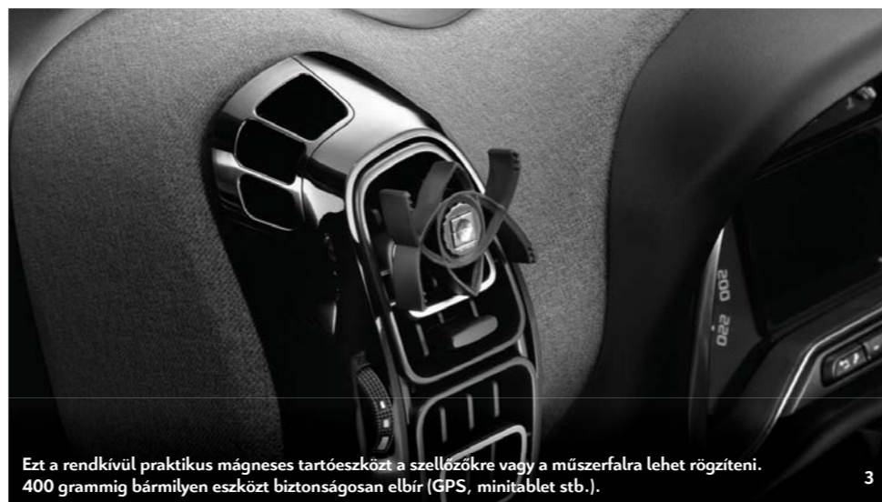
Ezt a rendkívül praktikus mágneses tartóeszközt a szellőzőkre vagy a műszerfalra lehet rögzíteni. 400 grammig bármilyen eszközt biztonságosan elbír (GPS, minitáblát stb.).